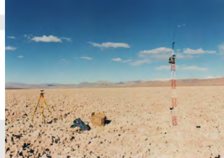
Figura 2. Antena base de transmissão dos dados

Atualmente a Esteio trabalha com o RTK na locação de loteamentos ao longo das faixas de dutos da Petrobrás, na locação dos pontos de sondagens para os estudos de travessias, e nos serviços de batimetria. Existem diversos aplicativos nos softwares de navegação que facilitam a localização dos pontos, com a facilidade da configuração dos sistemas de projeção, a correção da ondulação geoidal, entre outras.