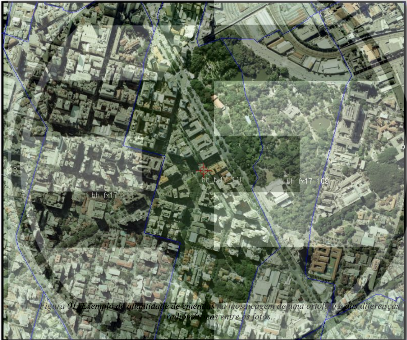
Figura 01 Exemplo da quantidade de emendas na mosaicação de uma ortofoto e das diferenças radiométricas entre as fotos.