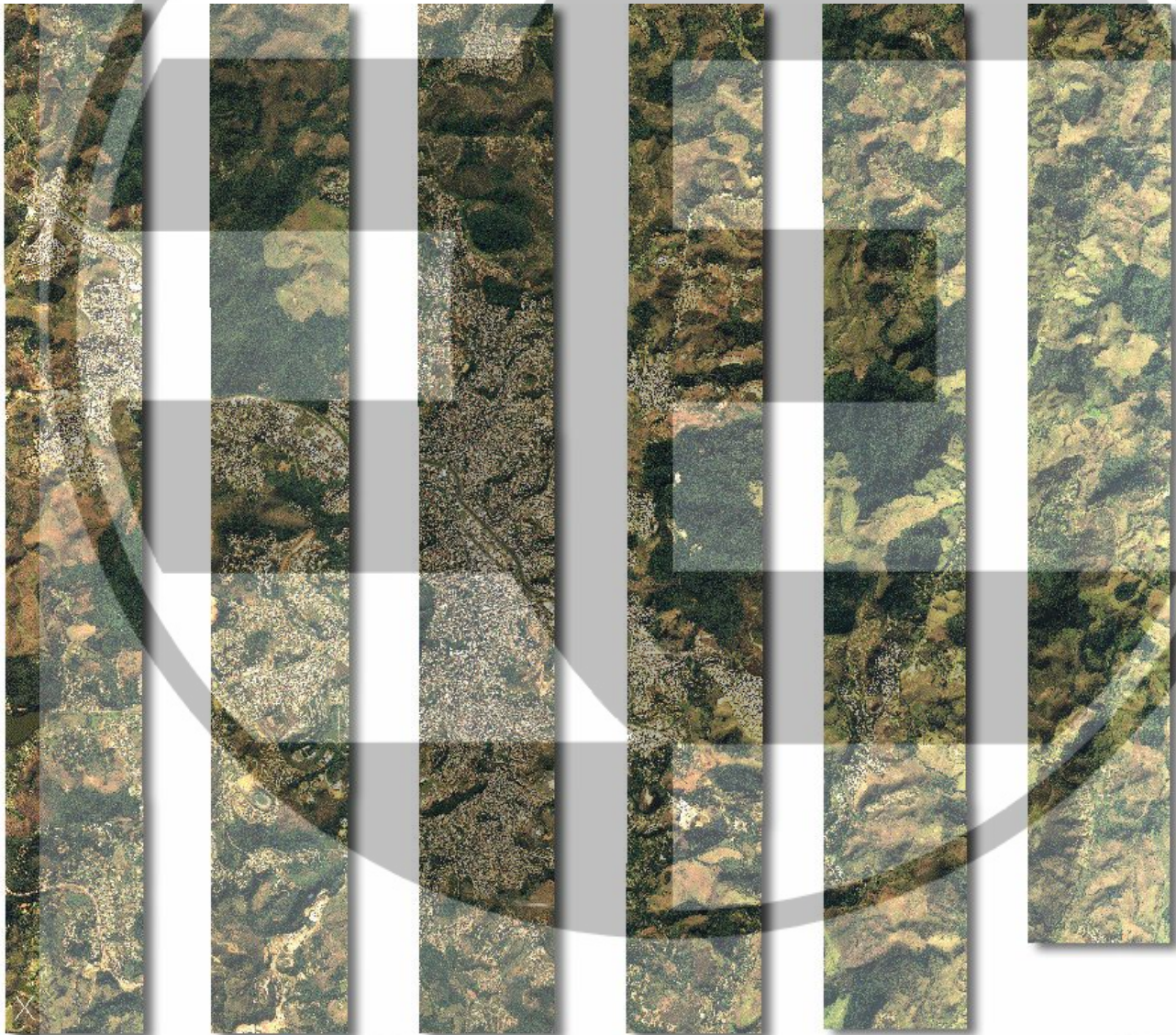
Figura 07_ Faixas de voo capturadas com ADS40 com sensor SH52