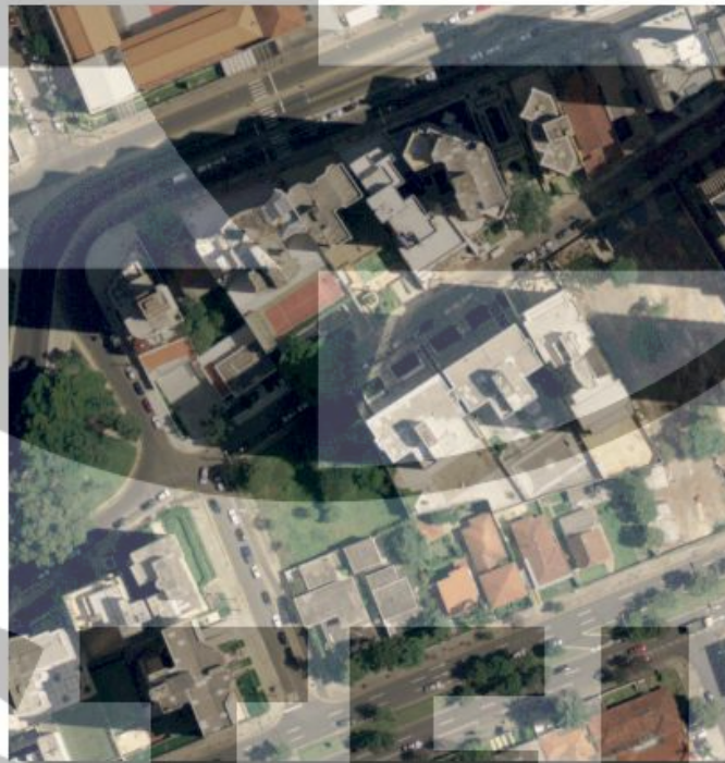
Figura 04_Região de prédios, com sombras, capturada com ADS40 com sensor SH52.