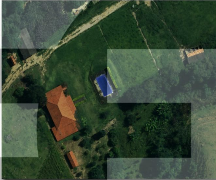
Figura 05_ Imagem capturada com ADS40 com sensor SH52