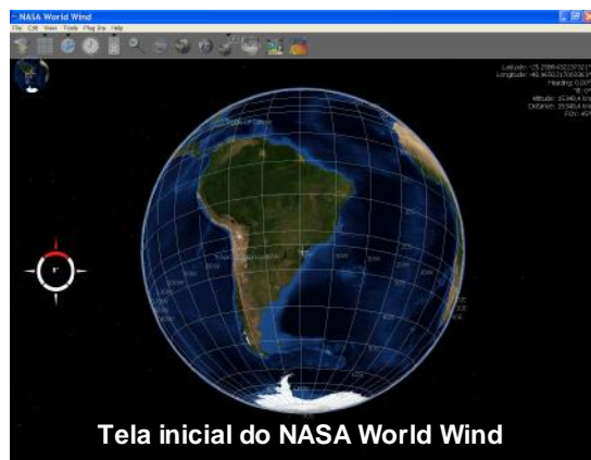
Tela inicial do NASA World Wind

Fotografias aéreas e imagens de satélites estão amplamente disponíveis para visualização na internet pelos programas Google Earth, Microsoft Virtual Earth e NASA World Wind. Esta recente disponibilidade está agitando o setor de geoinformações e trazendo inúmeras consequências benéficas a todo o mercado. Quantos de nós, mesmo os já envolvidos com o tema, não se surpreenderam com a facilidade em visualizar a nossa casa e aqueles lugares que antes só víamos em fotografias de viagens e cartões postais?