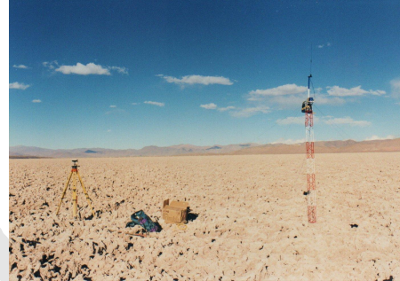
Figura 2. Antena base de transmissão dos dados

Atualmente a Esteio trabalha com o RTK na locação de loteamentos ao longo das faixas de dutos da Petrobrás, na locação dos pontos de sondagens para os estudos de travessias, e nos serviços de batimetria. Existem diversos aplicativos nos softwares de navegação que facilitam a localização dos pontos, com a facilidade da configuração dos sistemas de projeção, a correção da ondulação geoidal, entre outras.