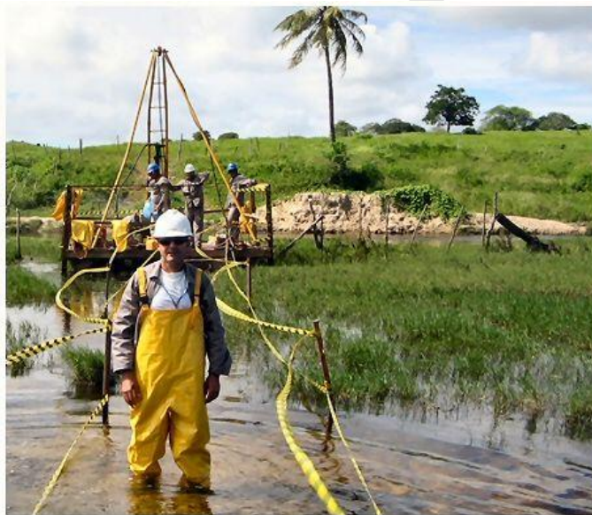
Sondagens, EPI's - uniforme manga longa, capacete, botina de segurança, perneira, óculos de segurança, protetor solar, luvas, protetor auricular e para locais alagados, macacão impermeável.