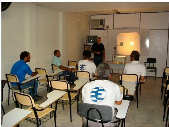
Curso de direção defensiva para todos os motoristas e condutores.