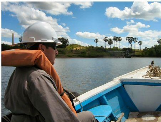
Em atividades sobre a água, adiciona-se ao EPI's coletes salva-vidas.