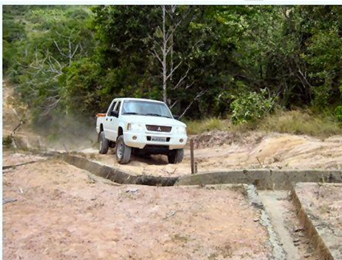
Curso de direção "off-roads" teórico e prático para condutores de veículos 4x4.