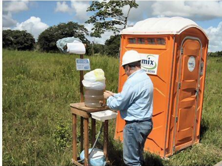
Banheiros químicos com lavador de mãos.