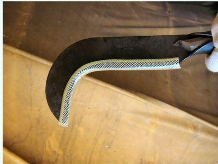
Boa prática, proteção para armazenamento e transporte de ferramentas cortantes.