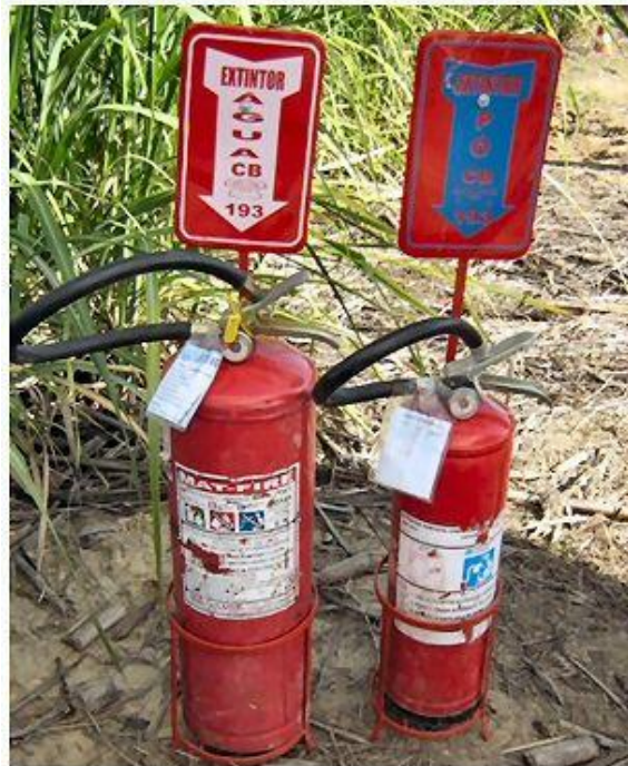
EPC - extintores de incêndio regularmente vistoriados.

Para as frentes de trabalho, onde as atividades não são itinerantes, ou duram ao menos um dia, fazemos uso de procedimentos de SMS, também chamados de boas práticas, entre os quais estão incluídos ainda os EPC's – Equipamentos de Proteção Coletiva. Todas estas boas práticas visam à segurança e a saúde dos trabalhadores, além de ações proativas de cuidado com o meio-ambiente.