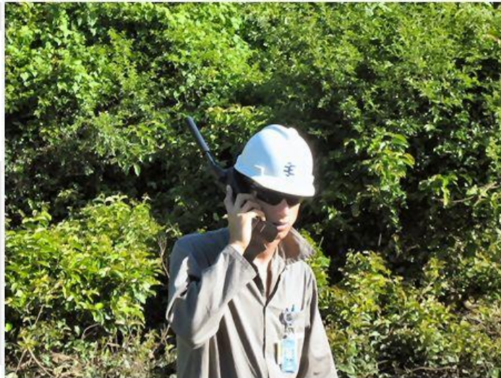
Comunicação, disponibilidade de telefones celulares ou telefones satelitais (Iridium).