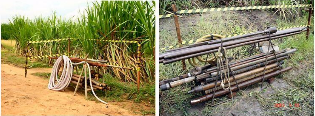
Organização - equipamentos devidamente acondicionados e sinalizados.