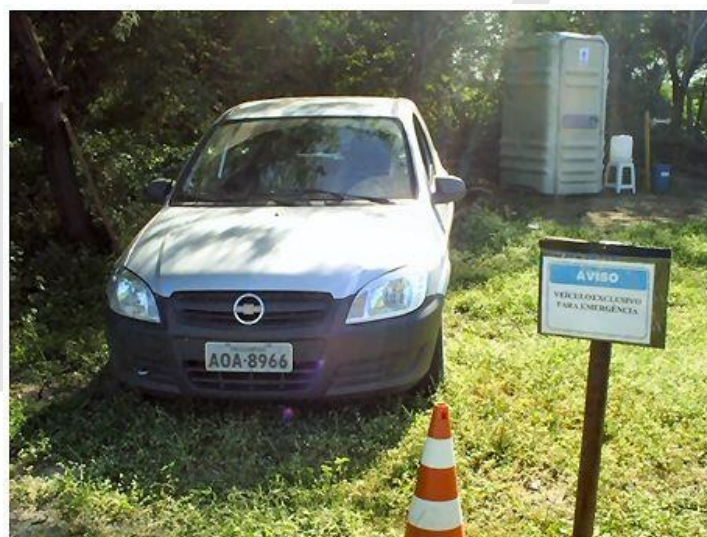
Veículo exclusivo para atendimento de emergências.