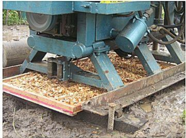
Preservação do solo, subsolo e mananciais, caixa de serragem para contenção de possíveis vazamentos do equipamento (motor da sonda rotativa).