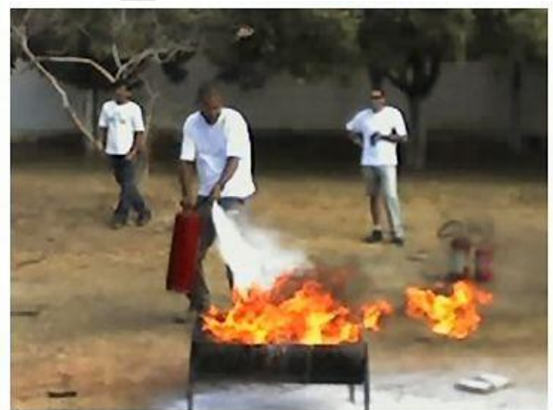
Curso de combate a incêndios.