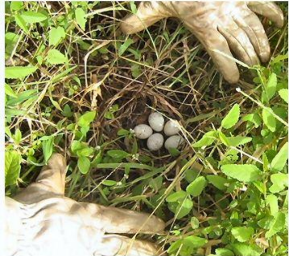
Preservação da fauna, na frente de trabalho ninho de aves preservado e sinalizado.