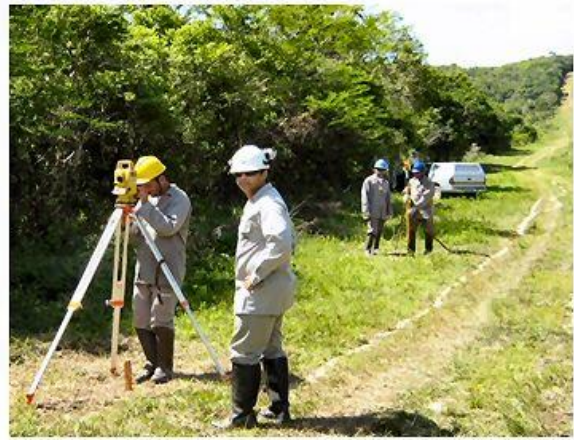
Trabalhos de Topografia, EPI's: uniforme manga longa, capacete, botina de segurança, perneira, óculos de segurança, protetor solar, coletes refletivos (quando em estradas).