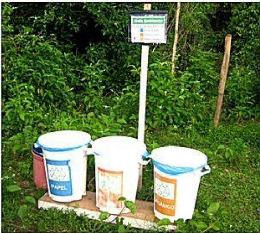
Preservação do Meio Ambiente, na frente de trabalho coleta seletiva de lixo.