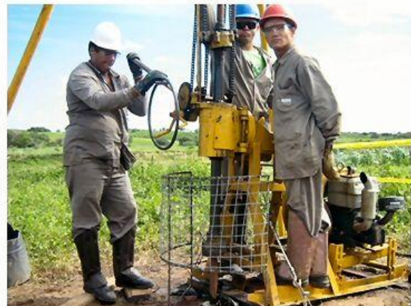
EPC - grade protetora para o eixo de rotação, sondagem rotativa.