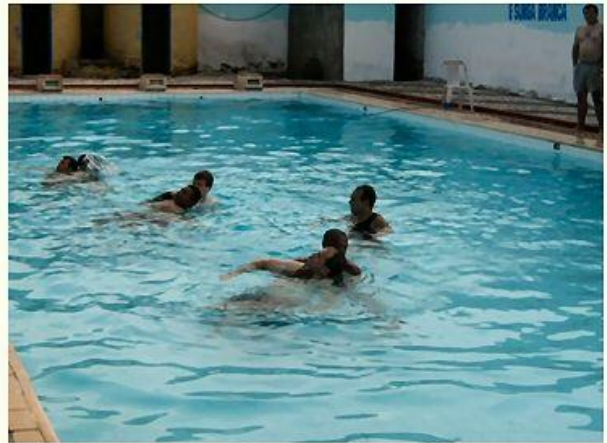
Curso de Salvatagem, para apoio a serviços em lâmina d'água.