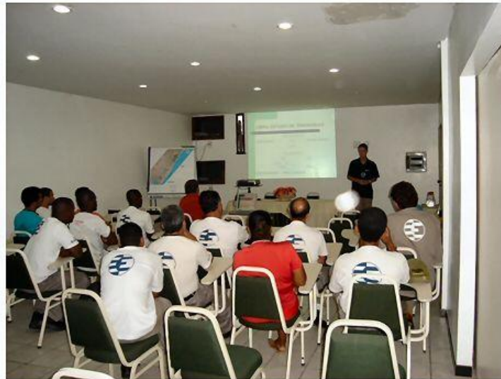
Curso de Integração para todos os colaboradores do serviço, conteúdo: a empresa, o contratante, o serviço, SMS.

Ainda outros treinamentos são fornecidos aos trabalhadores pela chefia e SMS da obra, treinamentos relativos aos planos elaborados para o trabalho, podendo ser apresentados na Integração ou mesmo em campo nos canteiros de trabalho, aglutinados ou em separado, para todos os trabalhadores ou para pessoas chave: