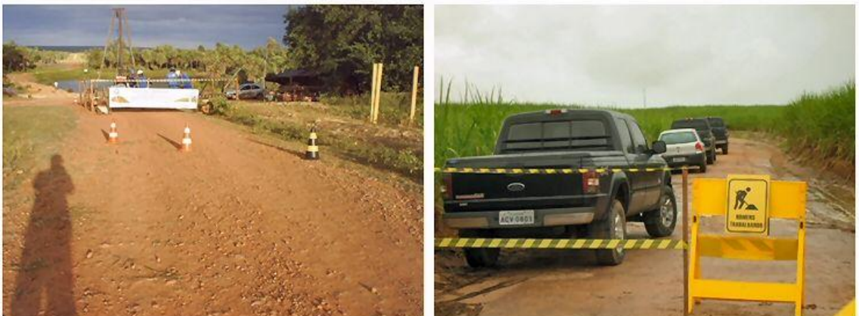
Sinalização e isolamento das áreas de trabalho para segurança da população vizinha.