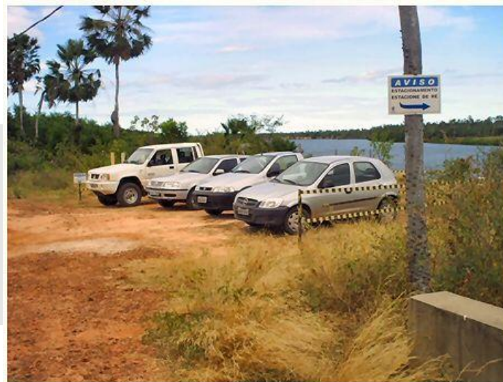
Estacionamentos - carros em posição de evasão, agilidade em casos de emergência.