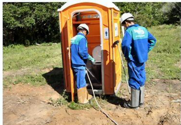
Preservação dos mananciais, limpeza dos sanitários químicos por empresa licenciada.