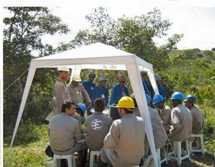
DDSMS – Diálogo Diário De Segurança, Meio Ambiente e Saúde. Conversa diária, de aproximadamente 15 minutos sobre temas relacionados a SMS, no início das atividades para todos os trabalhadores, geralmente na frente de trabalho.